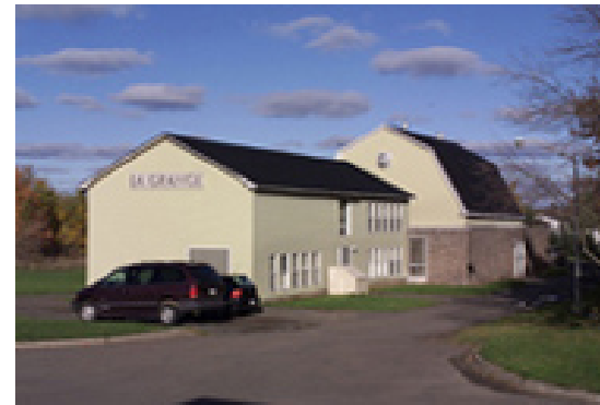
Studio-Théâtre La grange