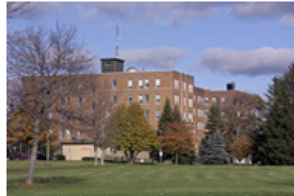
Pavillon Léopold-Taillon Faculté des sciences sociales