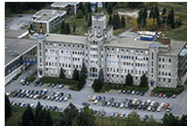
Pavillon Simon-Larouche (bâtiment principal)