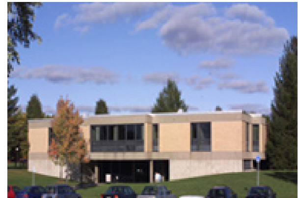
Pavillon Jacqueline-Bouchard (nutrition et sciences infirmières)