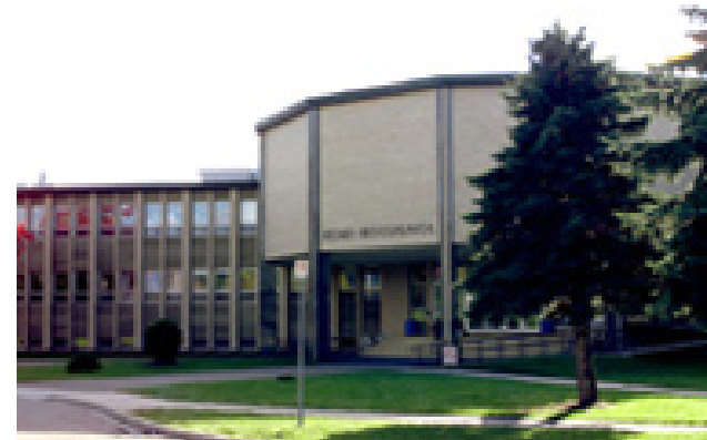
Pavillon Rémi-Rossignol Faculté des sciences