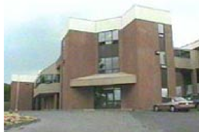
Faculté de foresterie

Que pensez-vous des commandites sur le site ACOc ou du bulletin ?