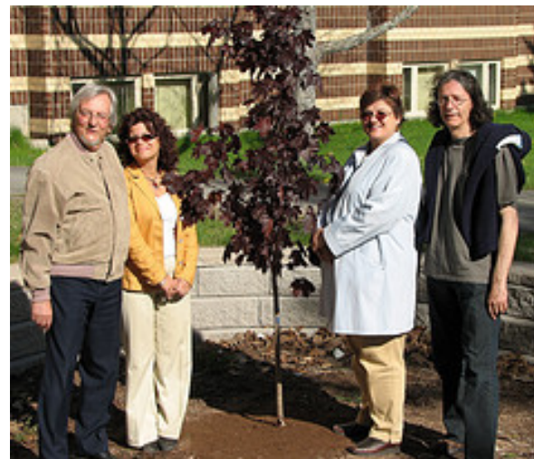
Au campus de Moncton avec « J'embarque »